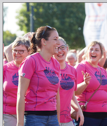
Ladywalk i Århus og på Samsø