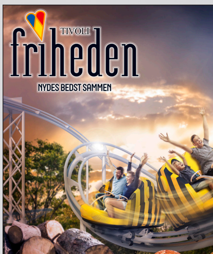
Rabatkupon til Tivoli Friheden i Århus